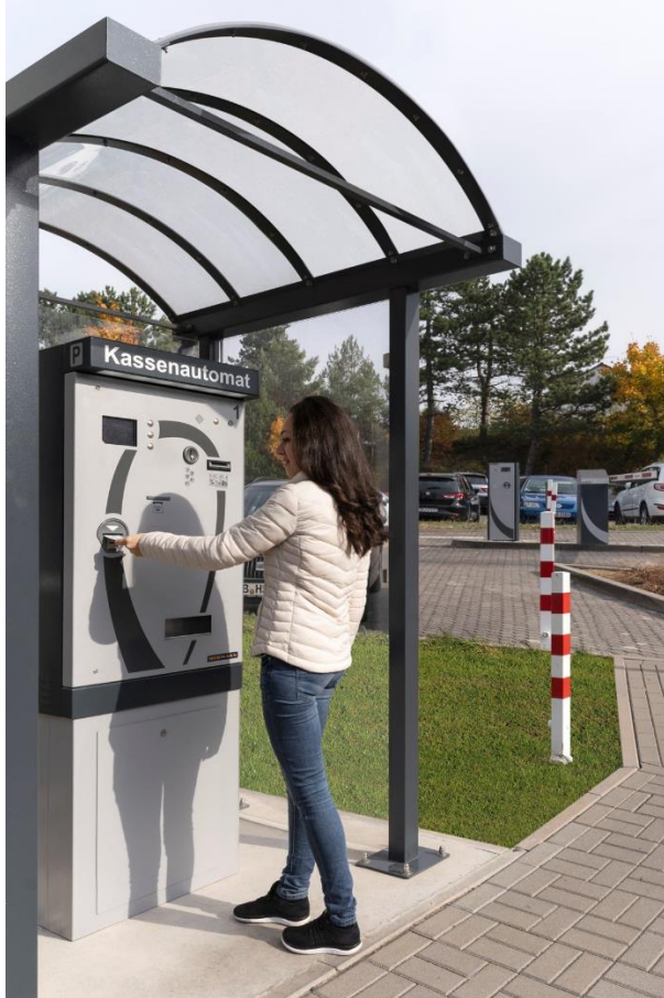
Bild 2: Kassensysteme können mit individuellen Bezahlssystemen (Bargeld, Kredit- und EC-Karten) betrieben werden.

Hörmann KG Verkaufsgesellschaft Tore · Türen · Zargen · Antriebe