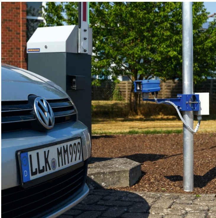
Bild 4: Bei der Nummernschilderkennung scannt eine Kamera das Nummernschild des Fahrzeugs, das zuvor im Ausweismanagement-System freigeschaltet werden muss.

Bild 3: Ein RFID Weitbereichsleser kann einen RFID Windschutzscheibenaufkleber erfassen und bei Berechtigung die Ein- oder Ausfahrt freigeben.